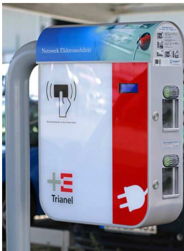
Die chargeIT mobility Ladebox für Trianel

In Zusammenarbeit mit der Stadtwerke-Kooperation Trianel bietet chargeIT mobility ihre Komplettlösung nun auch gezielt Stadtwerken an, um den Auf- und Ausbau der Ladeinfrastruktur in der breiten Fläche voranzutreiben. Das Angebot von chargeIT umfasst AC- und DC-, sowie E-Bike-Ladestationen. Die Komplettlösungen ermöglichen neben unterschiedlichen Abrechnungsarten wie SMS, RFID oder e-Roaming (via intercharge und e.clearing.net) die einfache Administration und Überwachung der einzelnen Ladevorgänge. Den Endkunden wird so ein größeres Netz an Ladestationen zur Verfügung gestellt, über die sie kostengünstig und unkompliziert Ihre Fahrzeuge laden können.