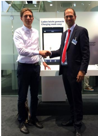
Bild 1: Unterzeichnung des Kooperationsvertrags von BELECTRIC Drive und Bosch Software Innovations