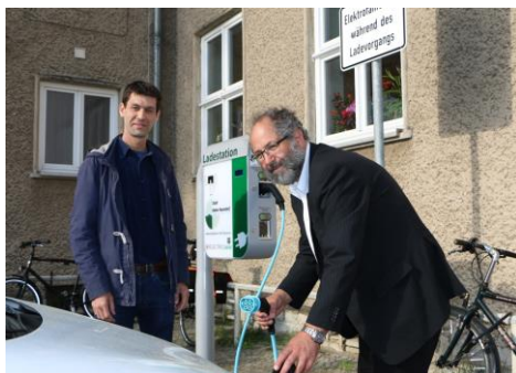
Bild: Inbetriebnahme des 400. Online Ladepunktes in Hohen-Neuendorf bei Berlin

Auch die komplette Verwaltung, Konfiguration und Überwachung der Ladesysteme kann BELECTRIC Drive – als E-Mobilitäts-Service-Dienstleister - übernehmen. Über einen umfassenden „Dienstleistungsvertrag“ wird auf Wunsch die gesamte Verwaltung, Abrechnung und Überwachung von den „Experten für Elektromobilität“ übernommen.