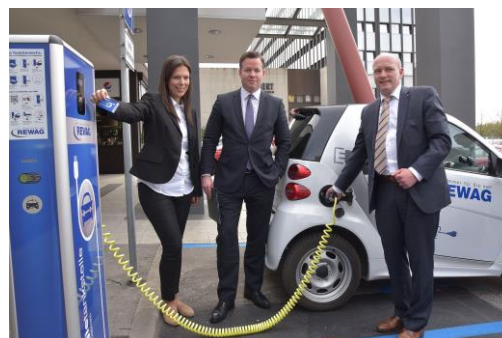
Bild: In der Region Regensburg gehen 36 Typ2-Schnellladepunkte von BELECTRIC Drive online (Quelle: REWAG AG)

Veröffentlichung und Nachdruck honorarfrei; ein Belegexemplar wird erbeten.